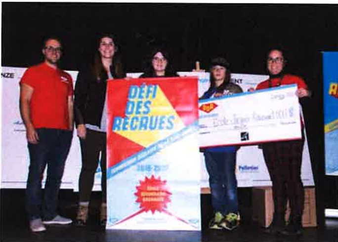
Le prix « Coup de coeur » a été remis aux élèves de La Taïga de Lebel-sur-Quévillon.

Baie-James a dévoilé les gagnants de cette 2 e édition.