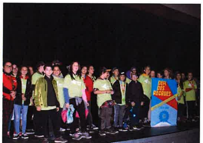
Les grands gagnants de la 2 e édition : les élèves de Jacques-Rousseau de Radisson.